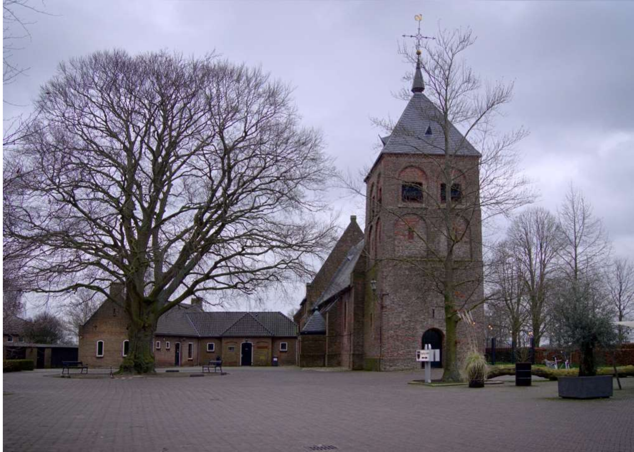
25-C- Wesepe, Kerkplein overzicht toren staat recht