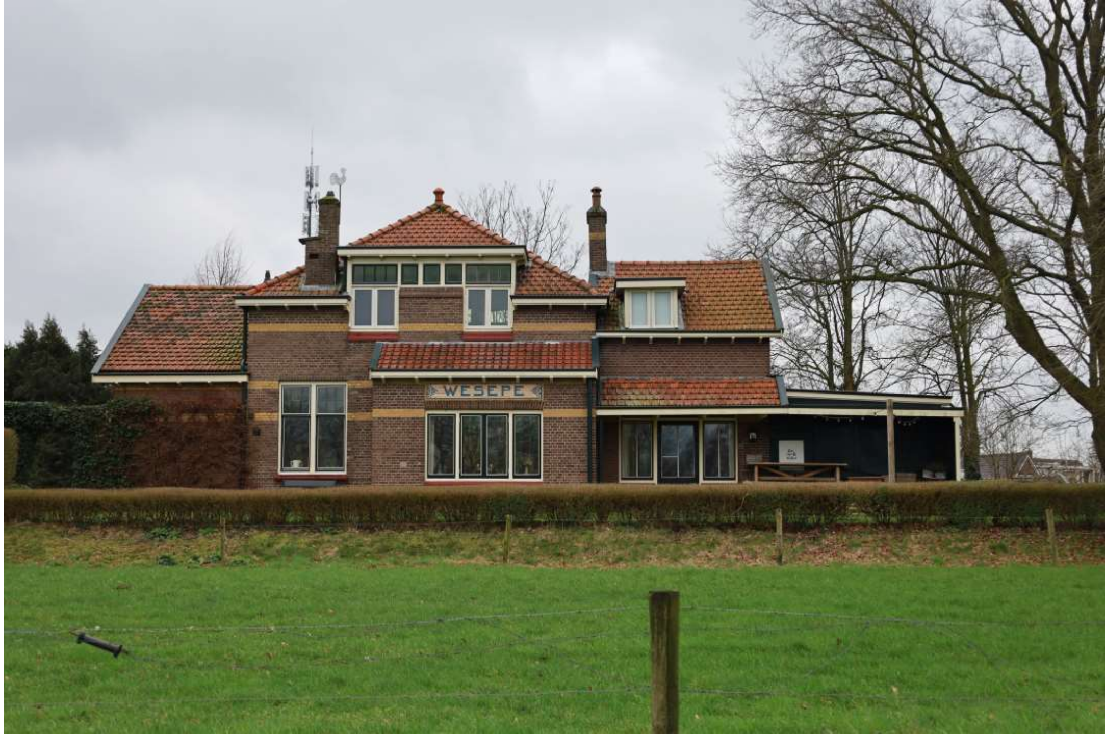
29-Wesepe Gezicht op het station