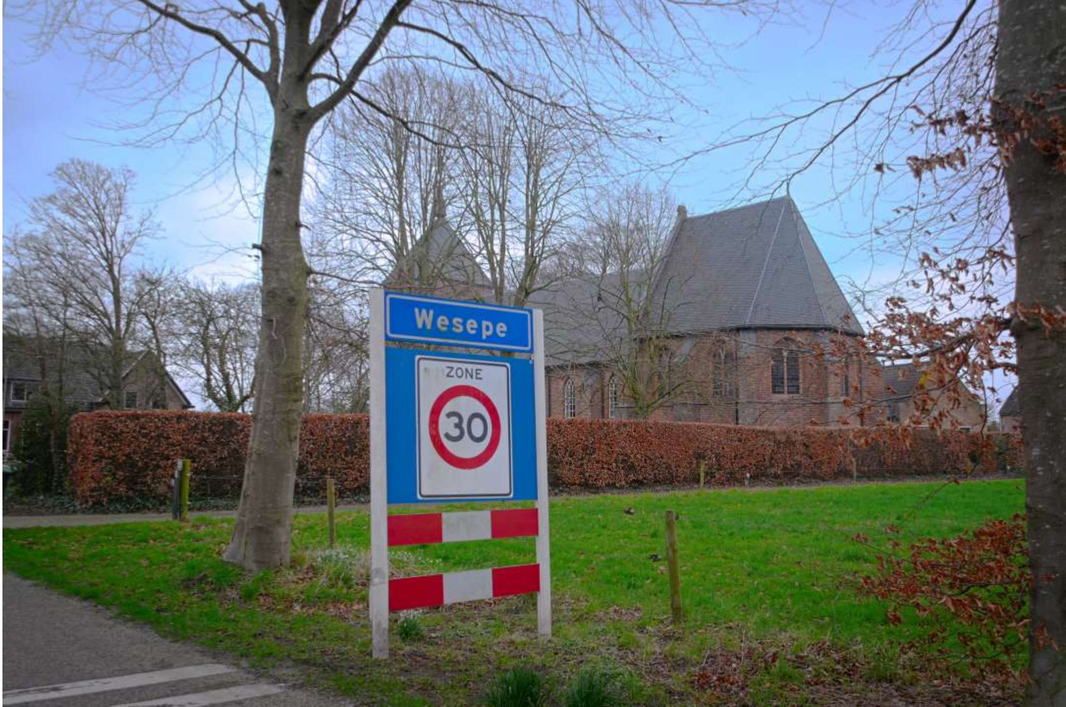
16-B-Wesepe plaatsnaam (mis straatnaam) beeldverhouding 3:2