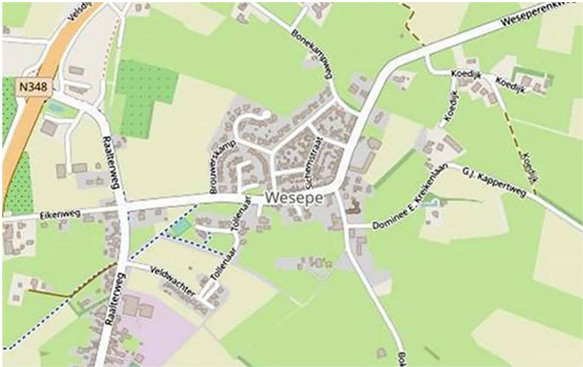
Wat we beter willen doen. | in groepjes verdelen | het dorp benaderen vanuit de verschillende invalswegen | beeldverhouding 3:2