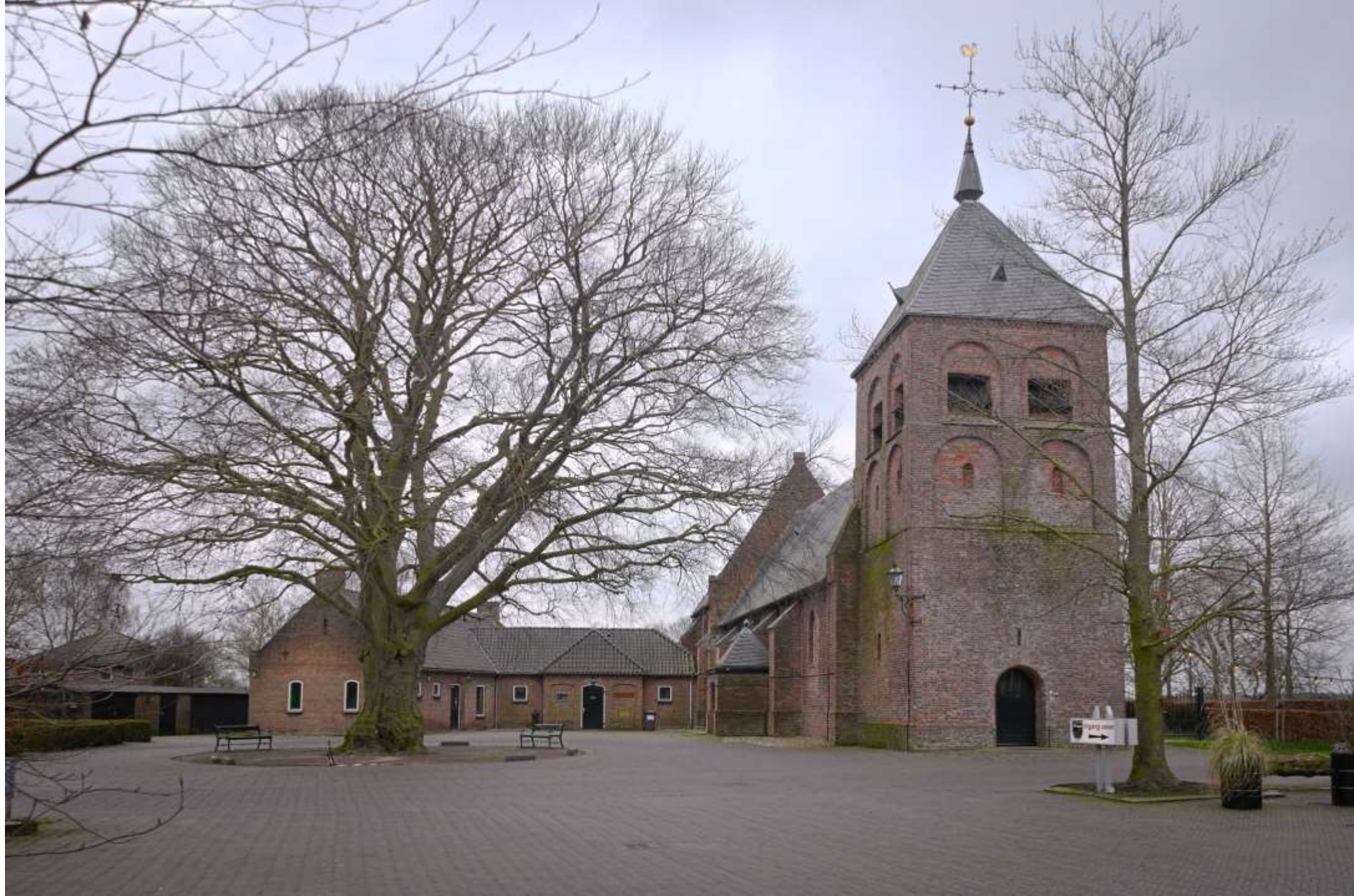
17-wesepe N H kerk (rechtgezet)