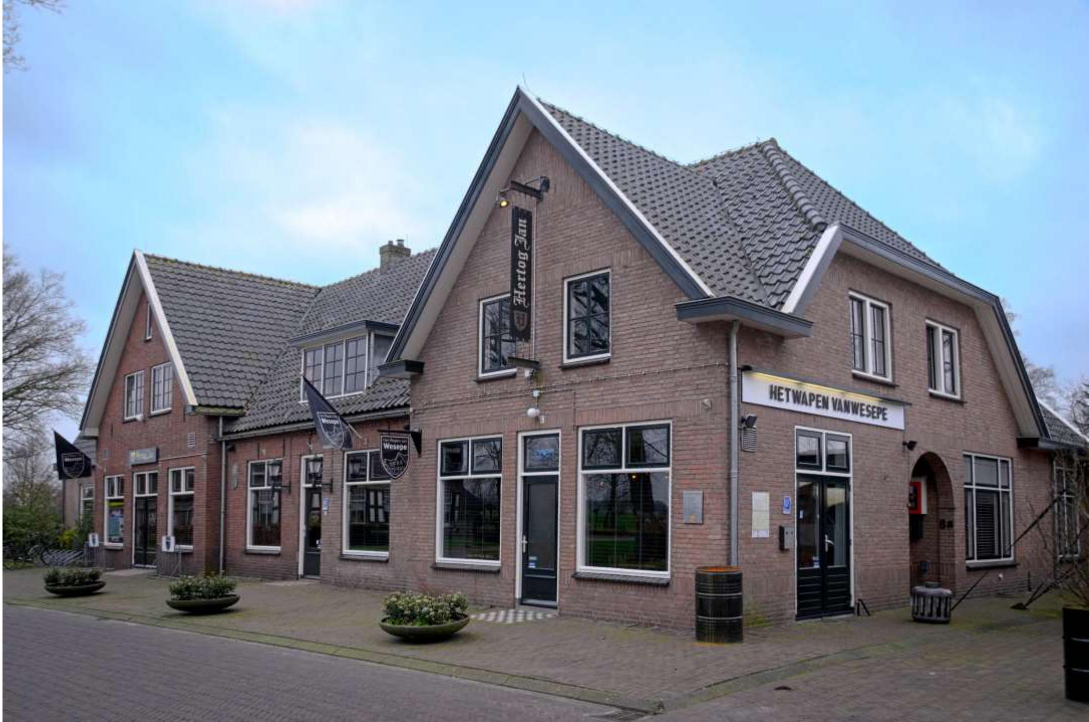
21-wesepe. Het Wapen van Wesepe. Rechter