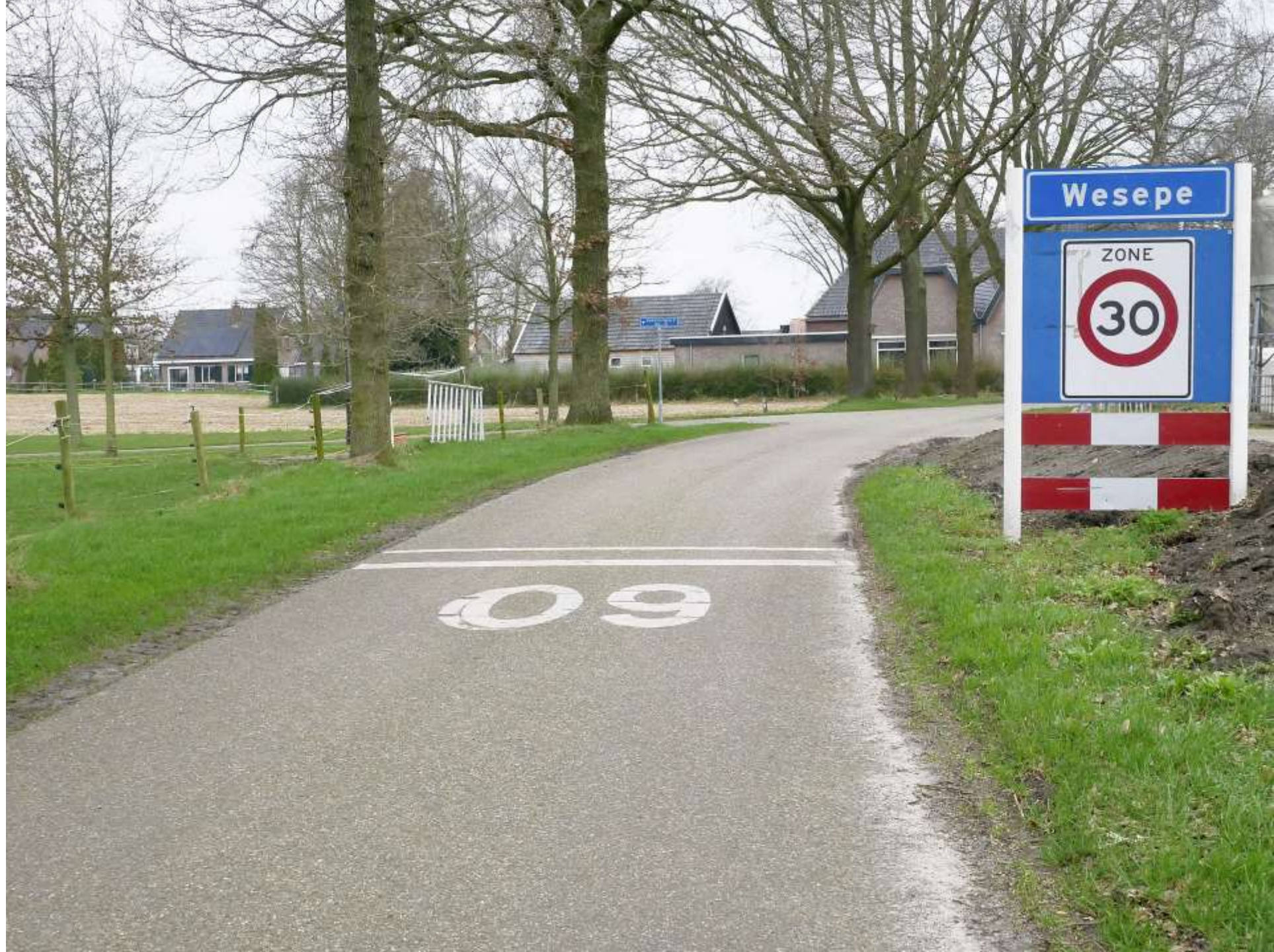
15-Wesepe plaatsnaam (mis straatnaam)