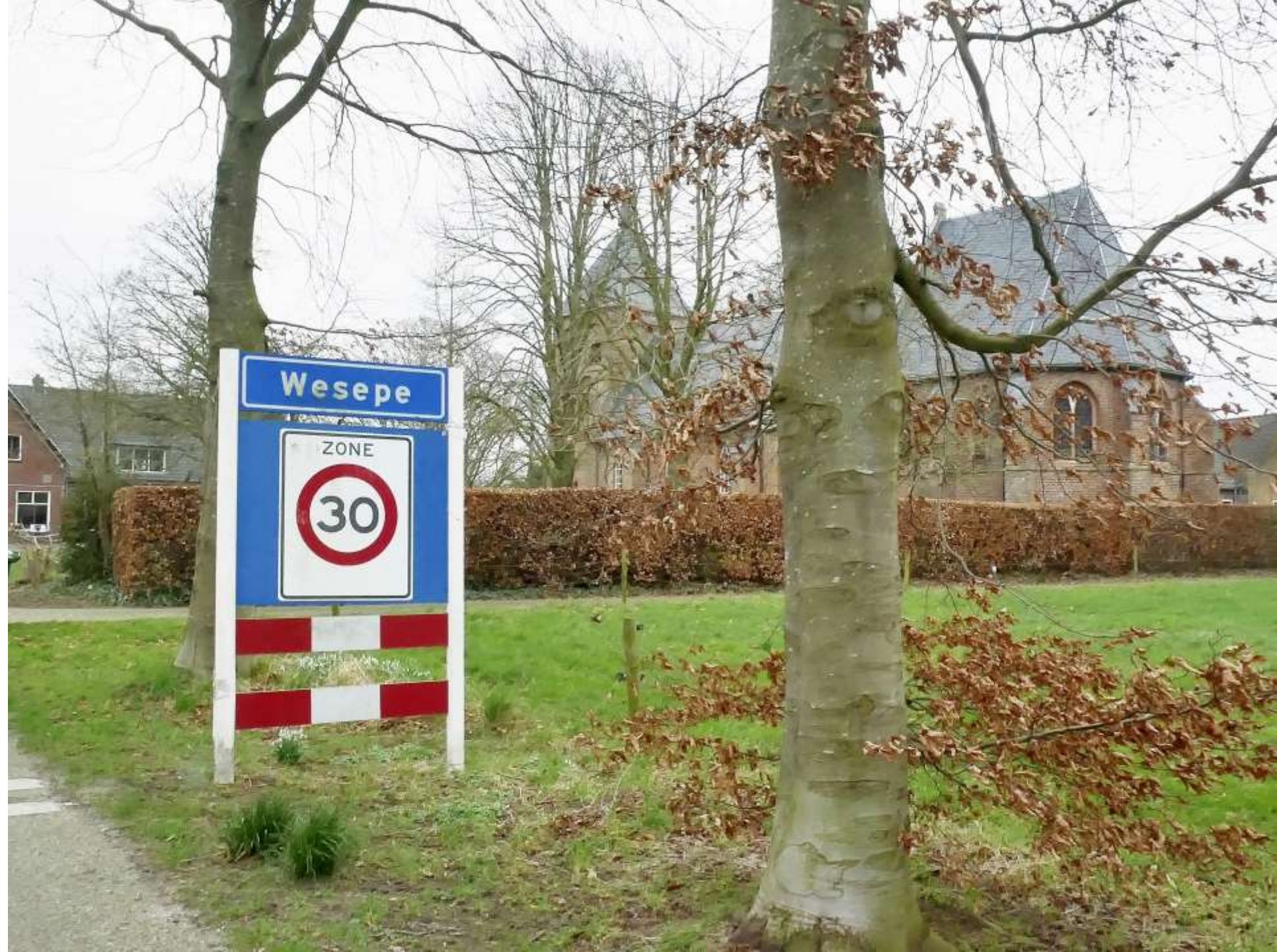
16-Wesepe plaatsnaam (mis straatnaam) beeldverhouding 4:3