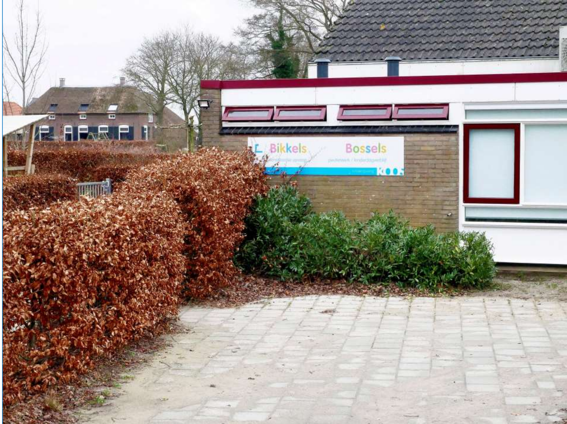
9-Wesepe kleuter & kinderopvang 2