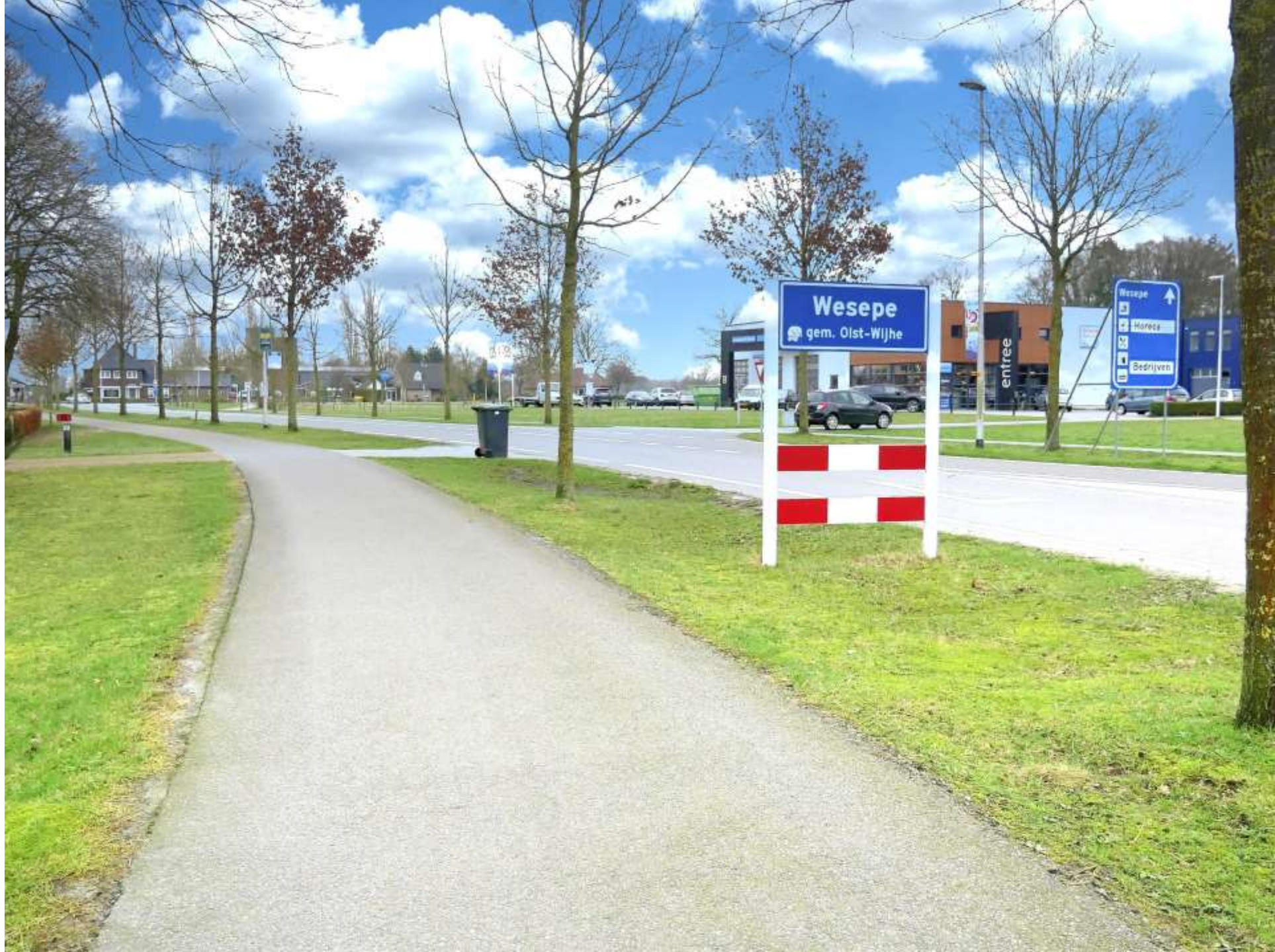
3-Wesepe naar bedrijven Met fietspad (donkerder)