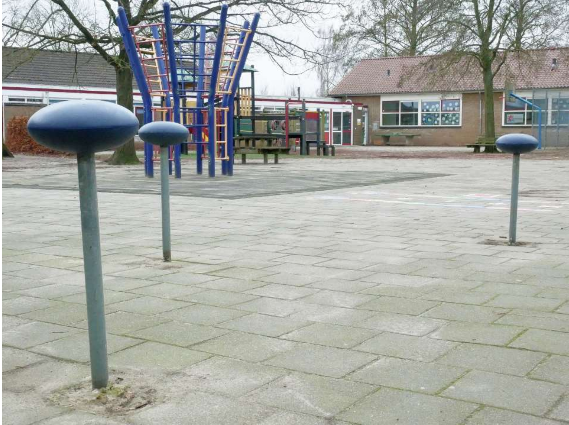
10-Wesepe obs A. Bosschool schoolplein (1)