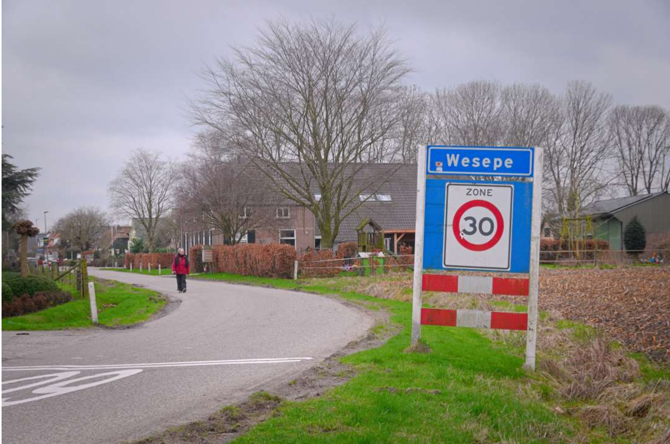
27- Wesepe Dorp uit richting ? Kan deze dame???