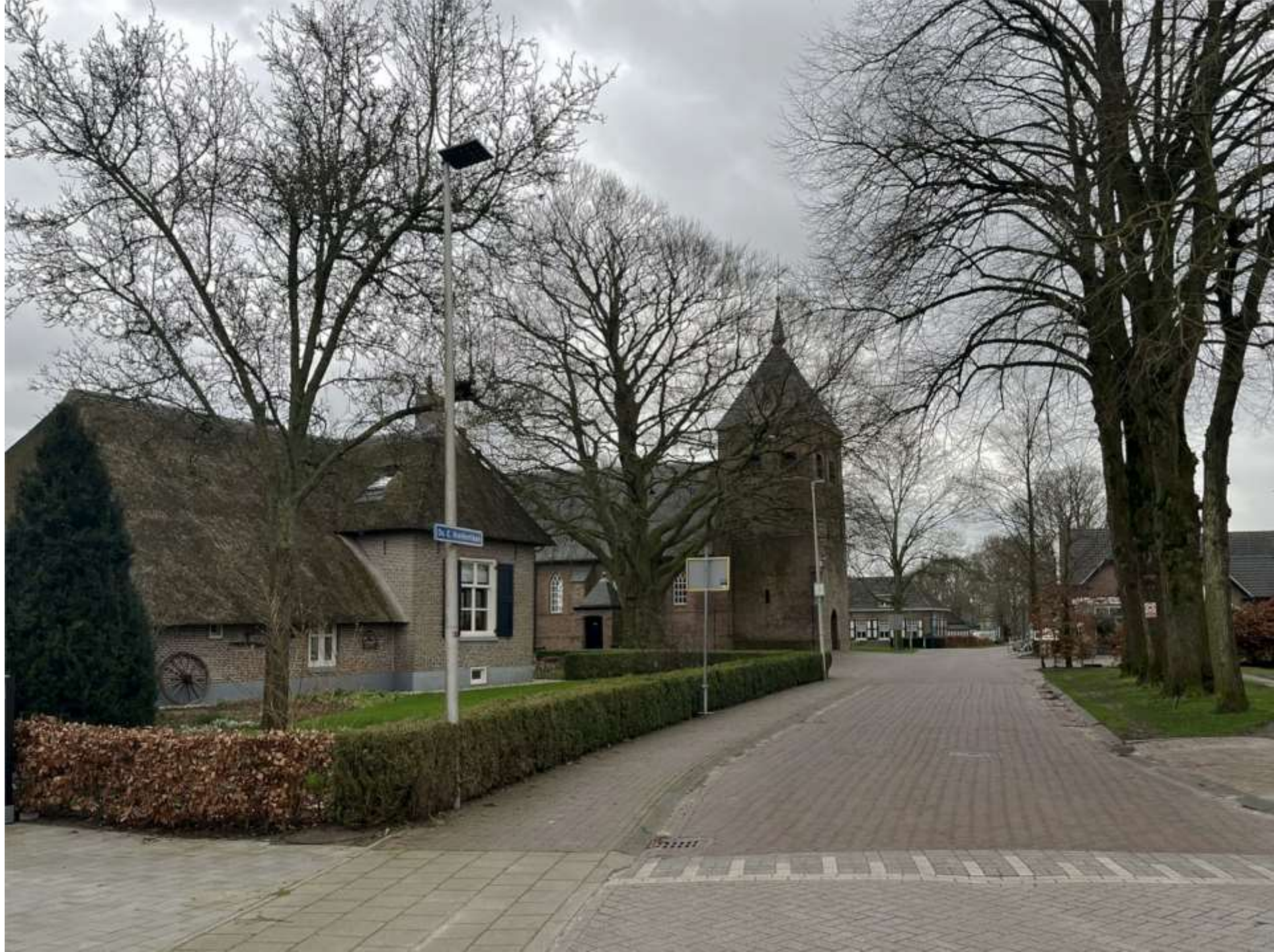
6-Wesepe Dominee E Kreikenlaan 3 gezicht op de kerk-2