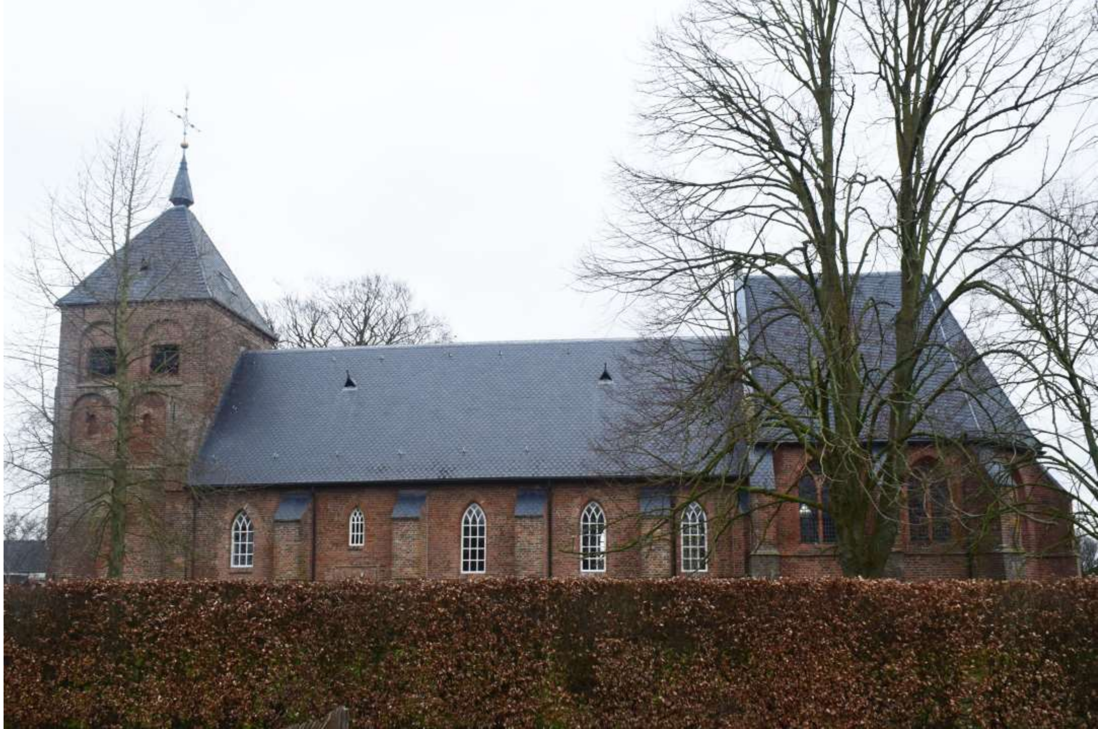
25-D- Wesepe, Zijkant van de kerk