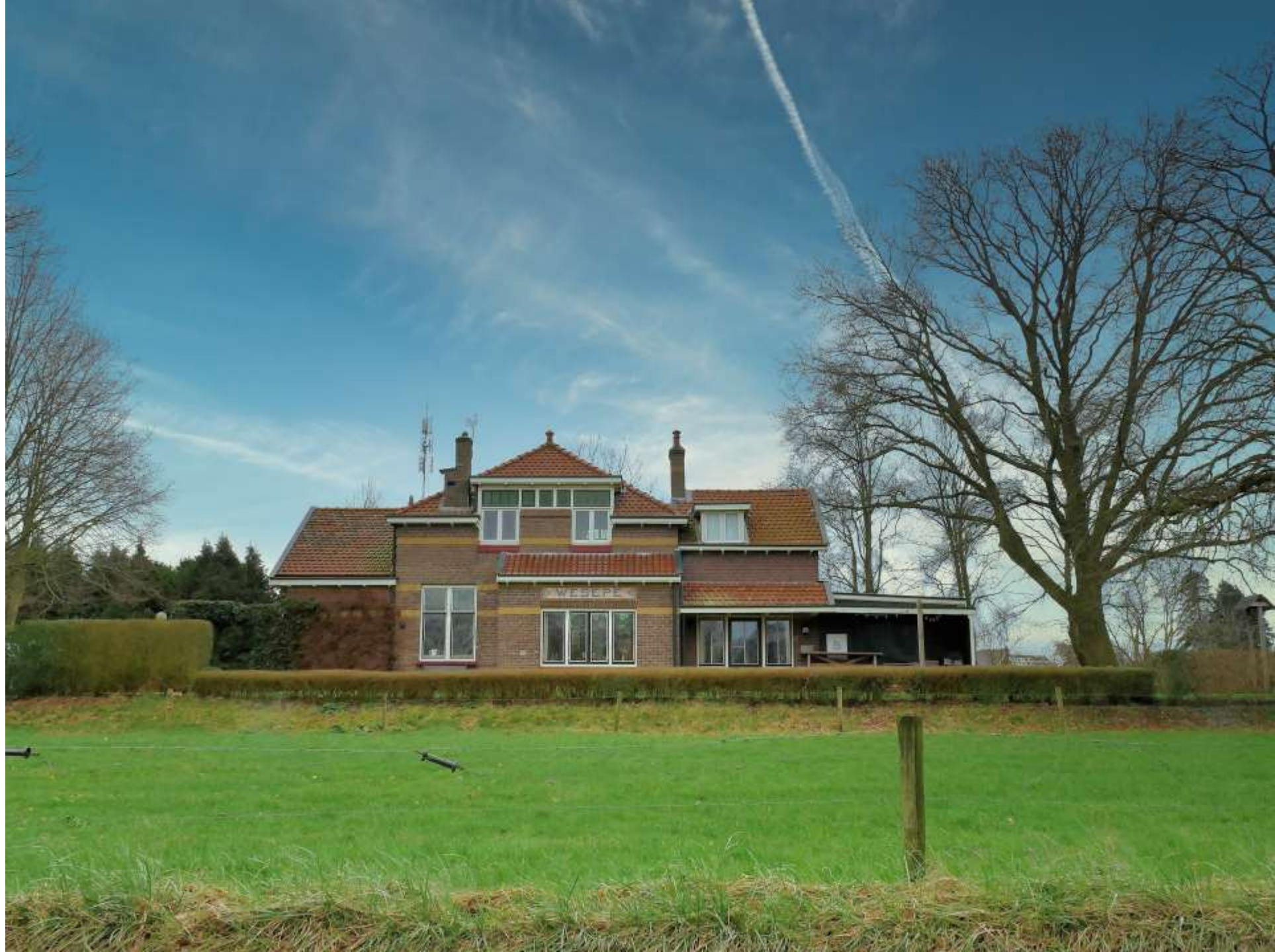
29-Wesepe Gezicht op het station Nieuwe lucht