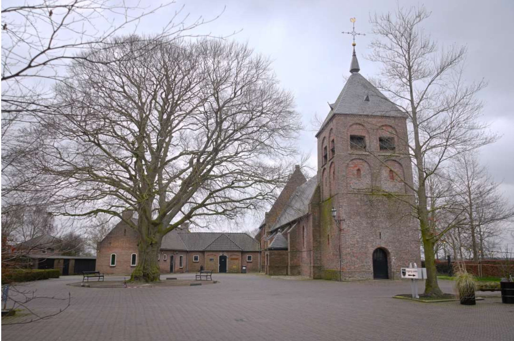
17-wesepe N H kerk