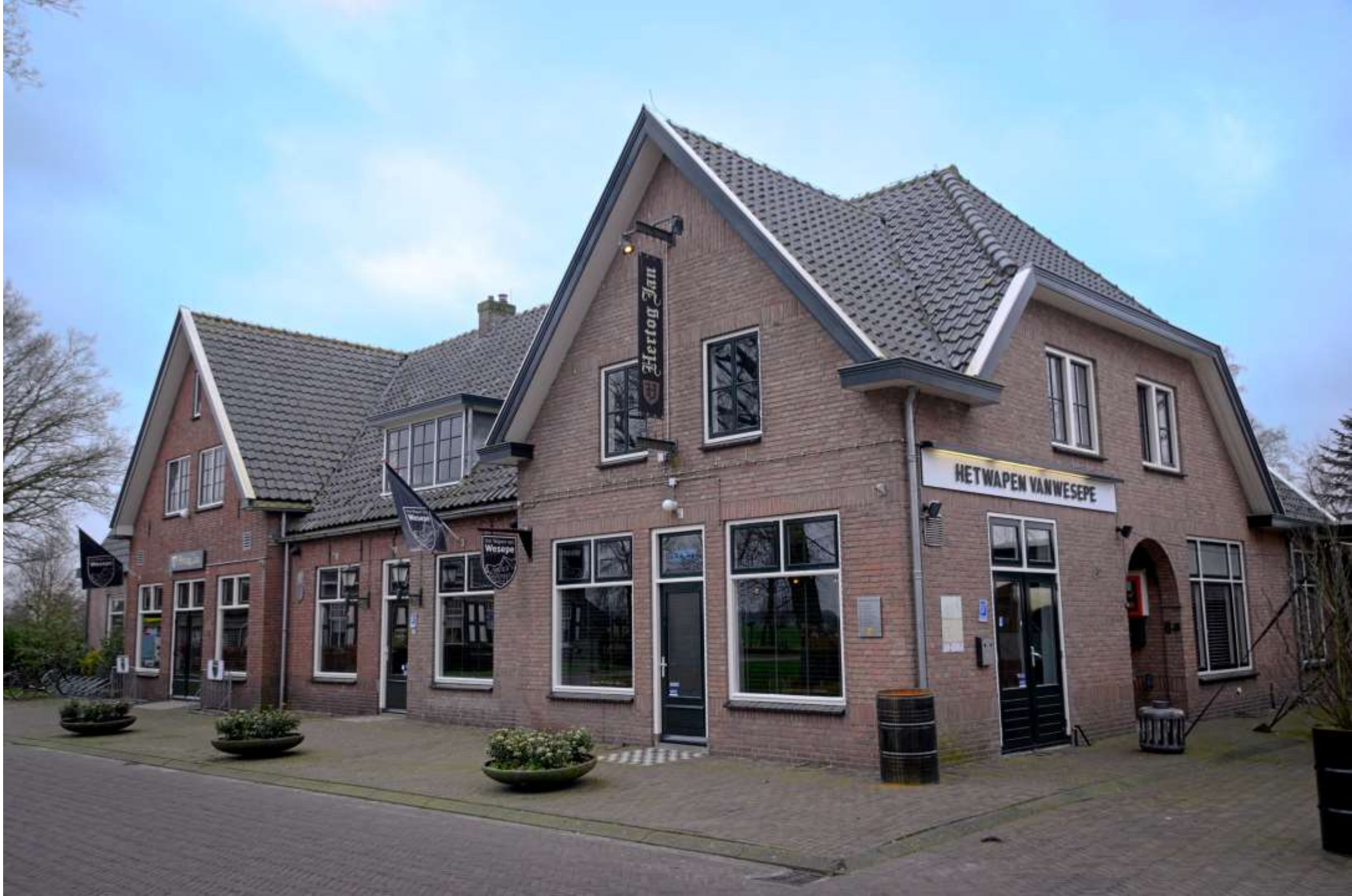
20-wesepe . Het Wapen van Wesepe.