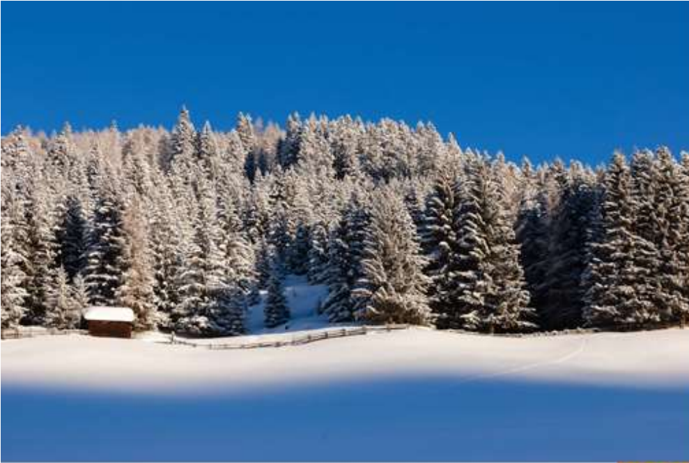
Van links naar rechts

Beeldverhouding mede bepalend voor de kijkrichting