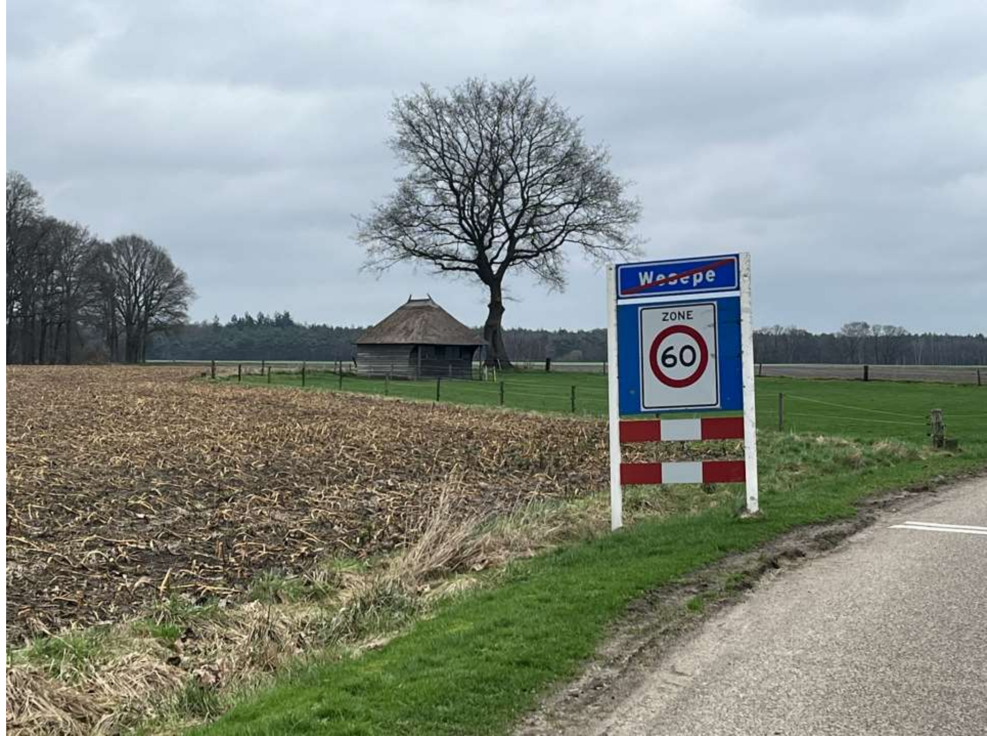
28-Wesepe, Weseprenkweg 1A, verlaten van het dorp