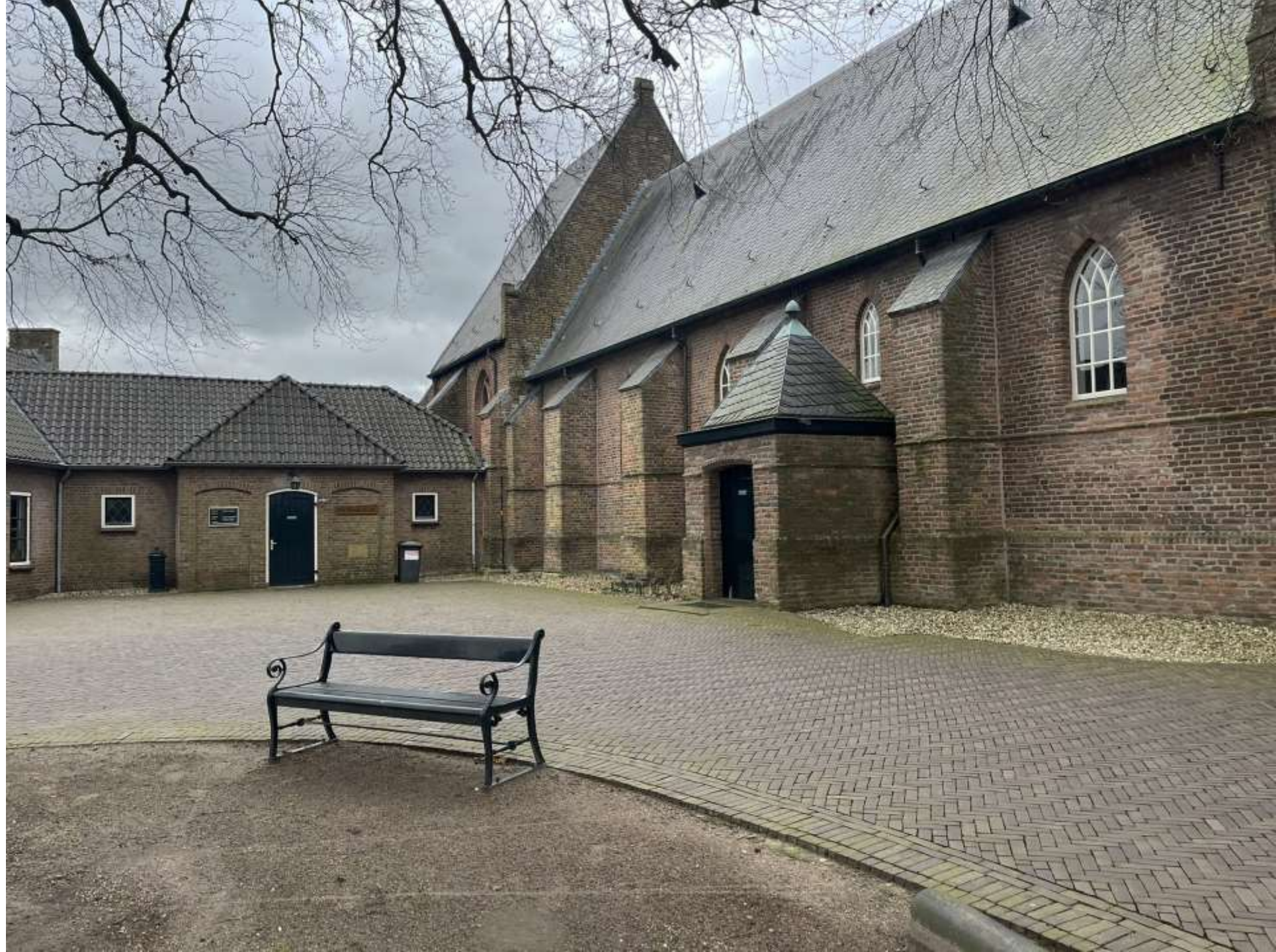
19-Wesepe' Dominee E Kreikenlaan 1, kerkplein detail