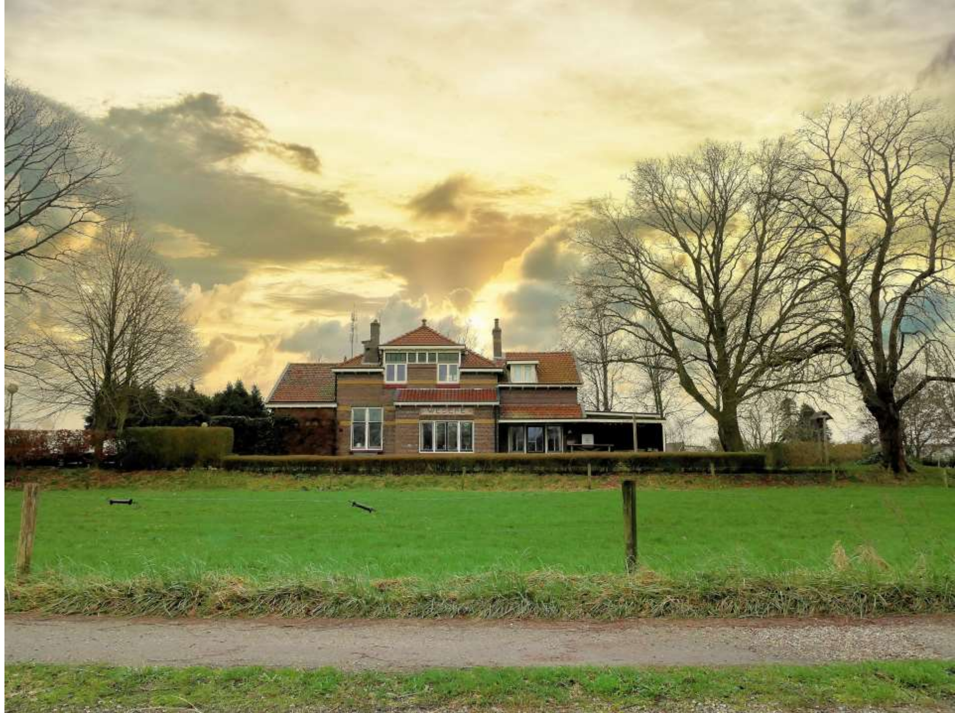
32-Wesepe Gezicht op het station Dramatische lucht