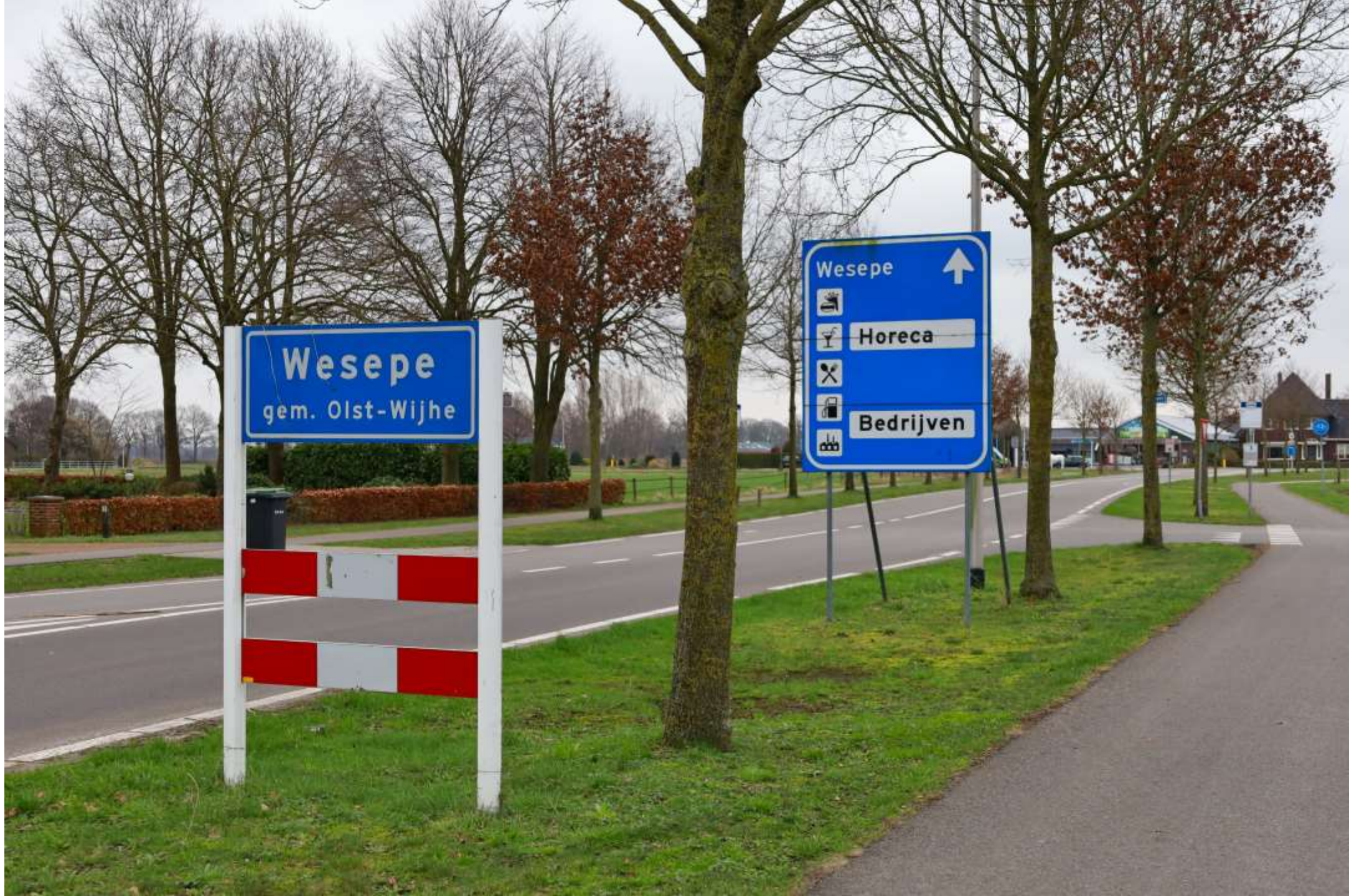
5-Wesepe Naar horeca en bedrijven