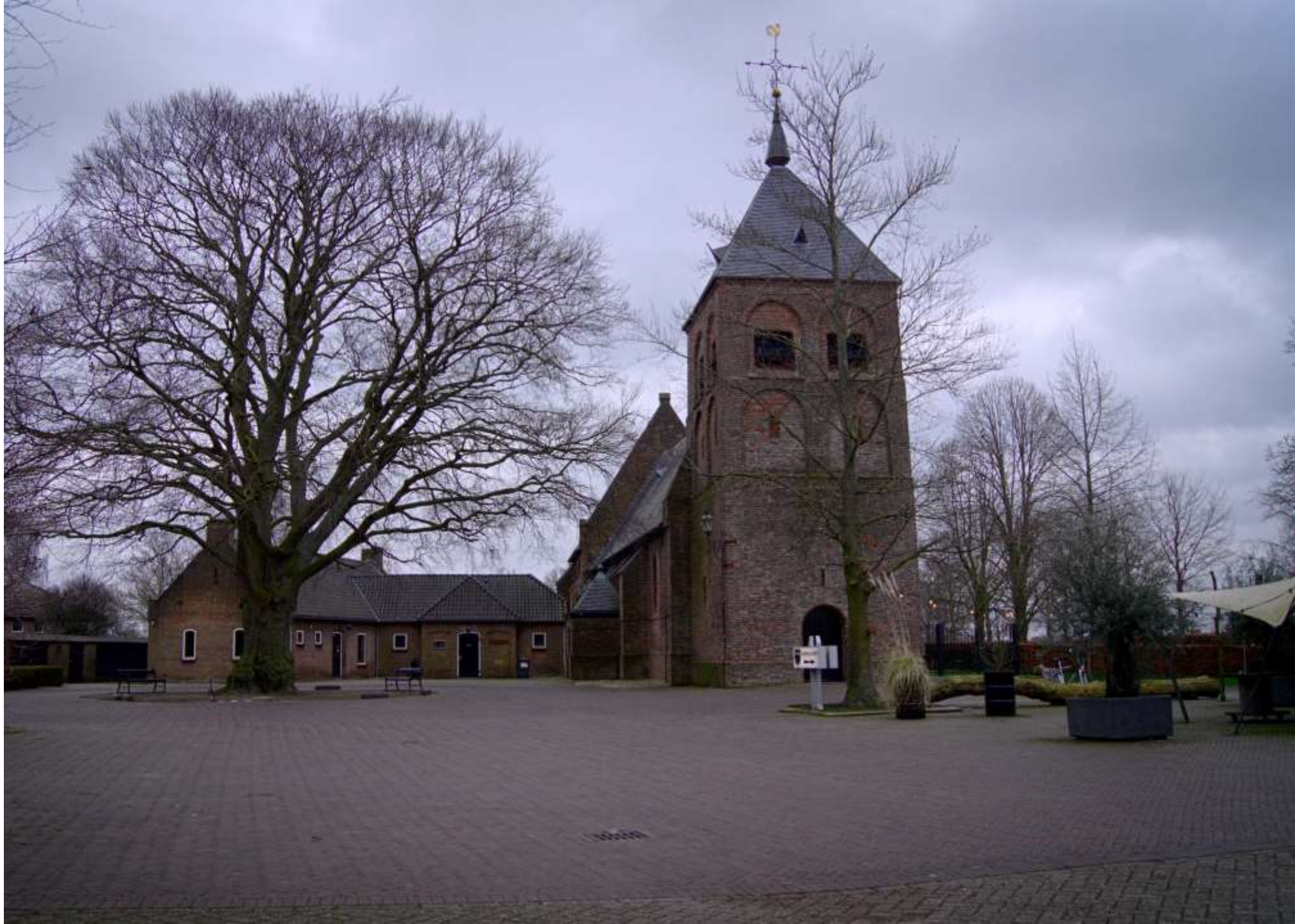
25-B-Wesepe, Kerkplein overzicht