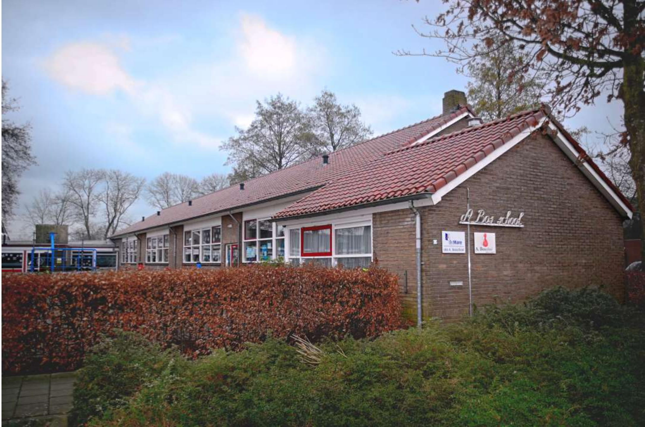
7-Wesepe A Bos school 1