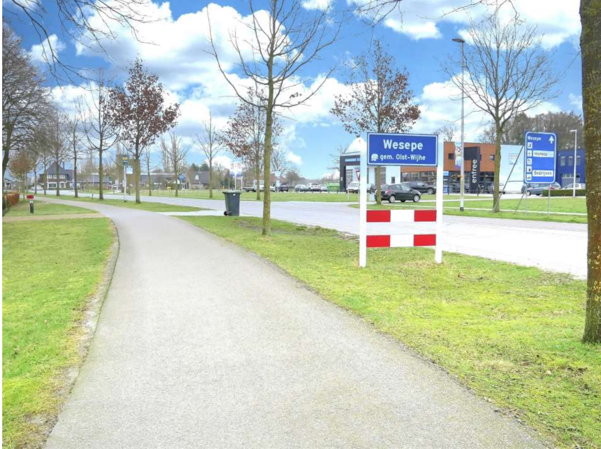
2-Wesepe naar bedrijven met fietspad