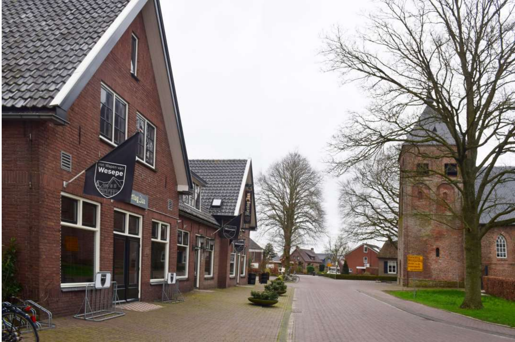
21-b-wesepe. Het Wapen van Wesepe.