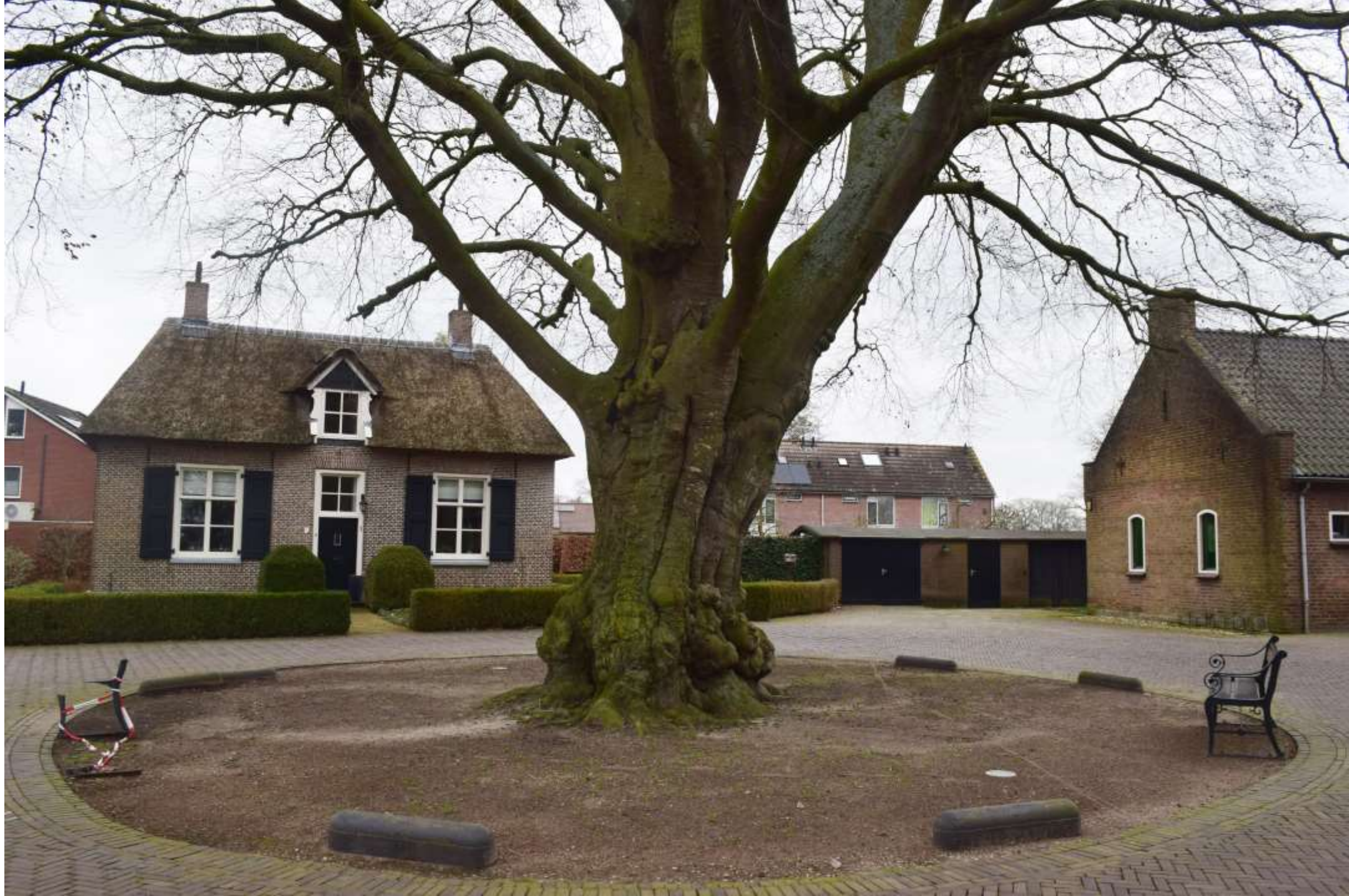
24-Wesepe, Dominee E. Kreikenlaan met rommeltjes