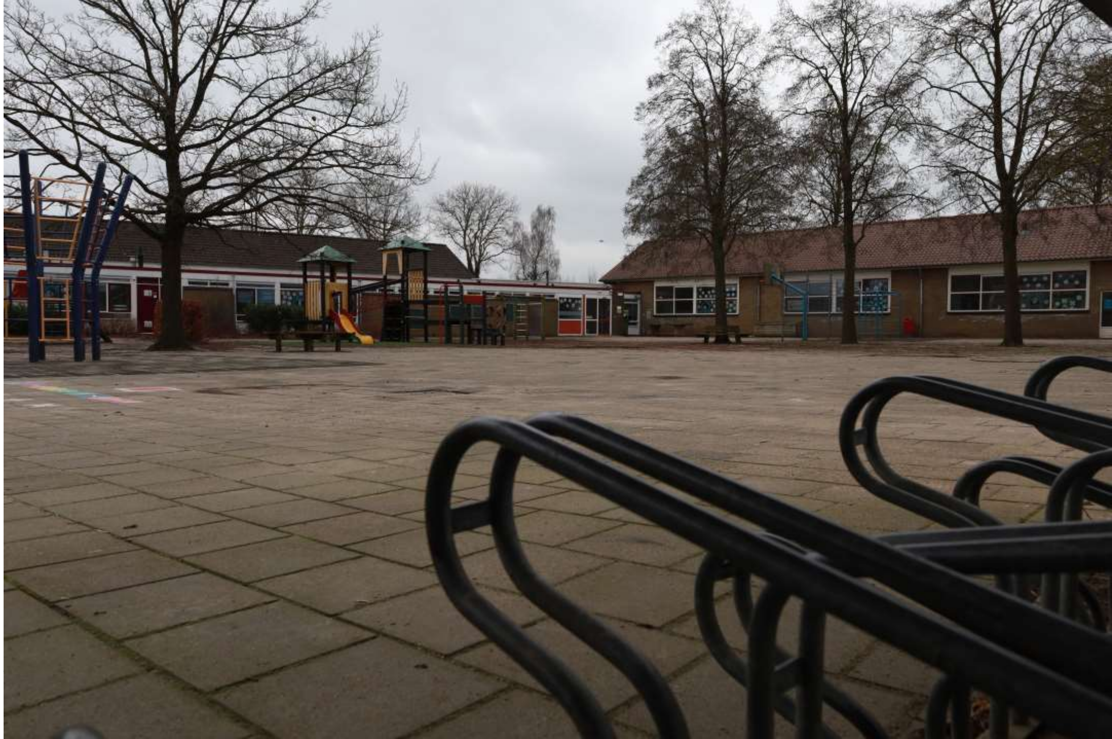
11-Wesepe obs Bosschool plein met