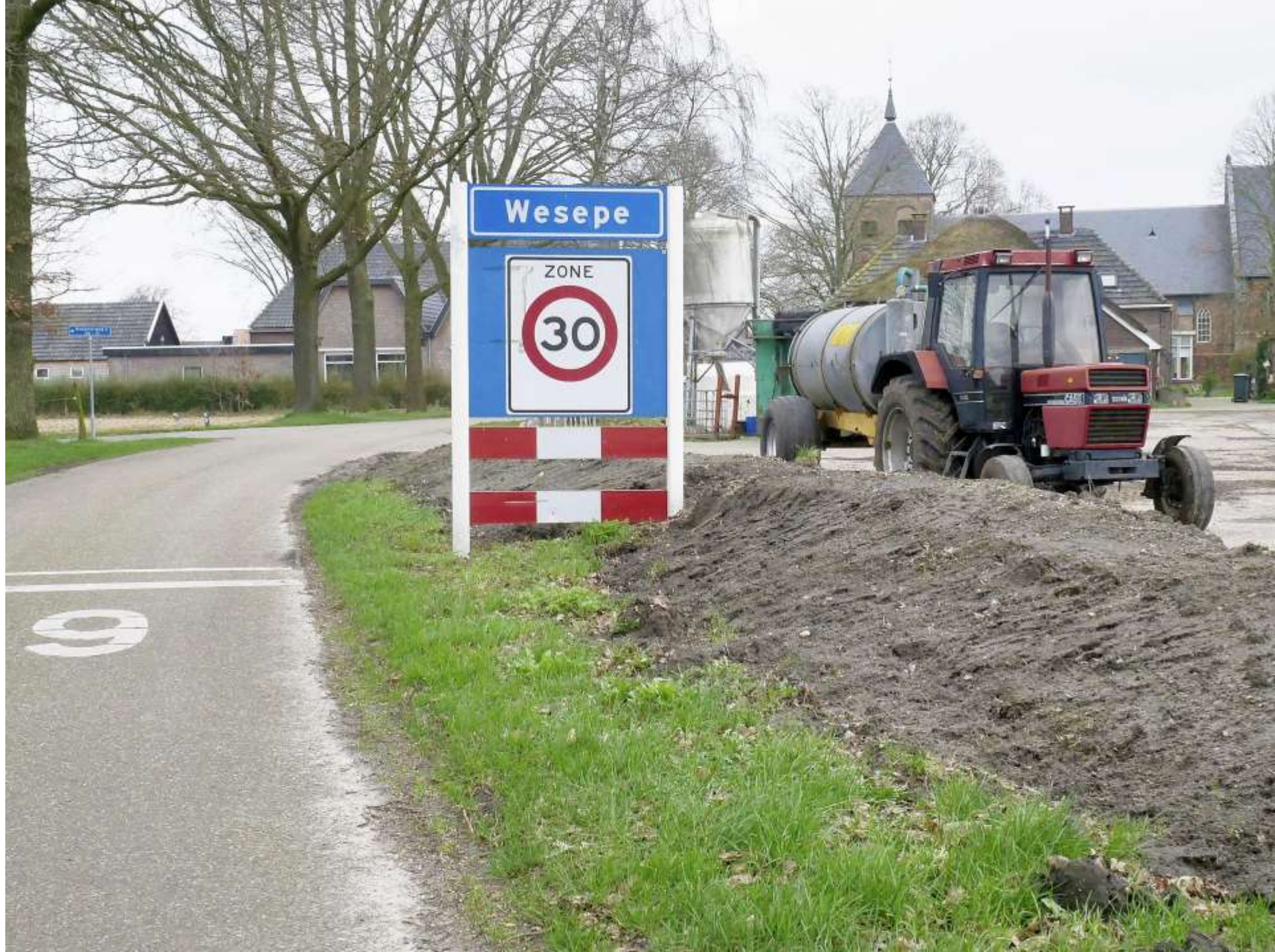
33-Wesepe Wesepe in bedrijf