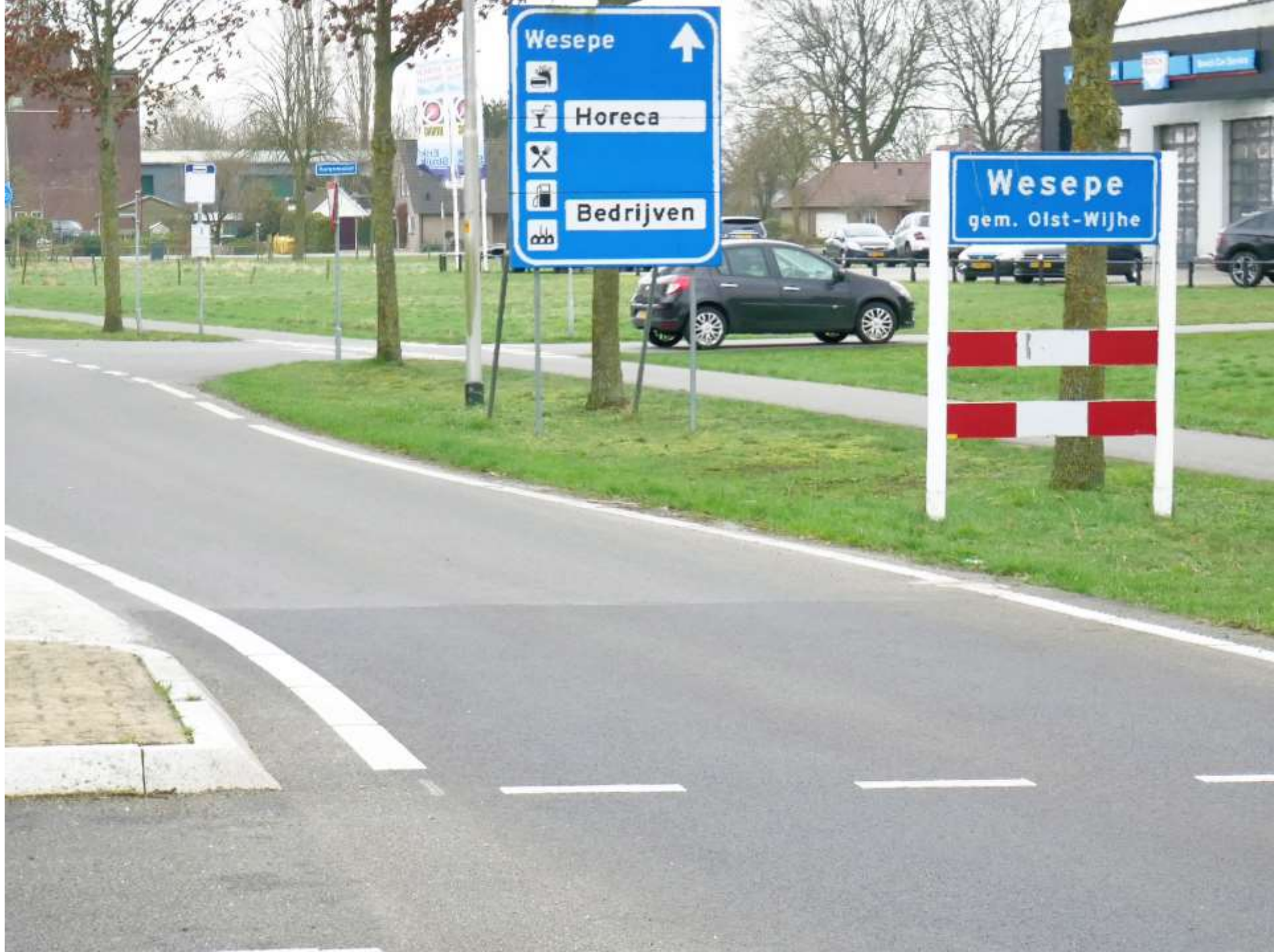
1-Wesepe naar bedrijven