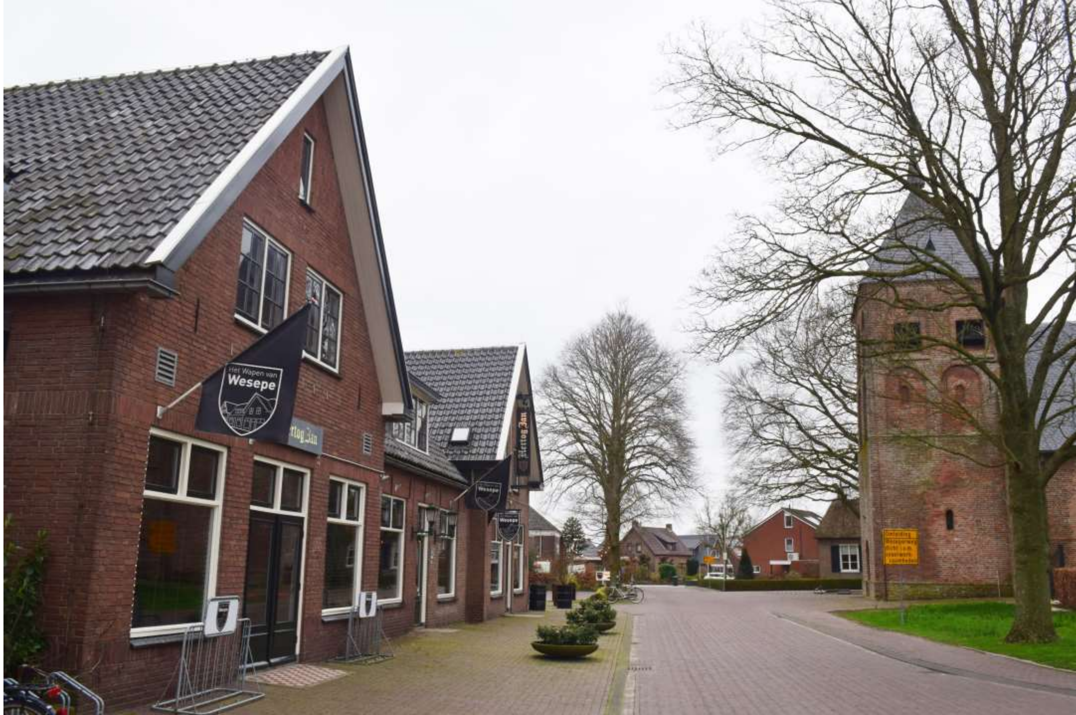
21-wesepe. Het Wapen van Wesepe.