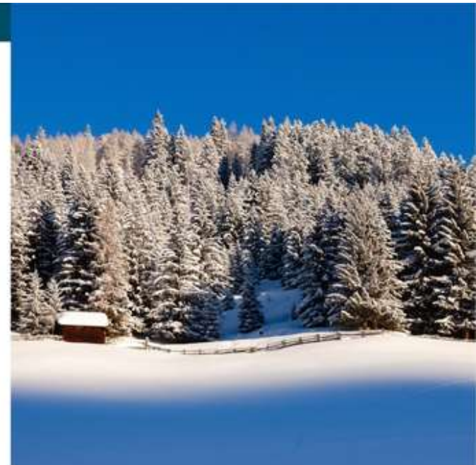
Oog voor detail