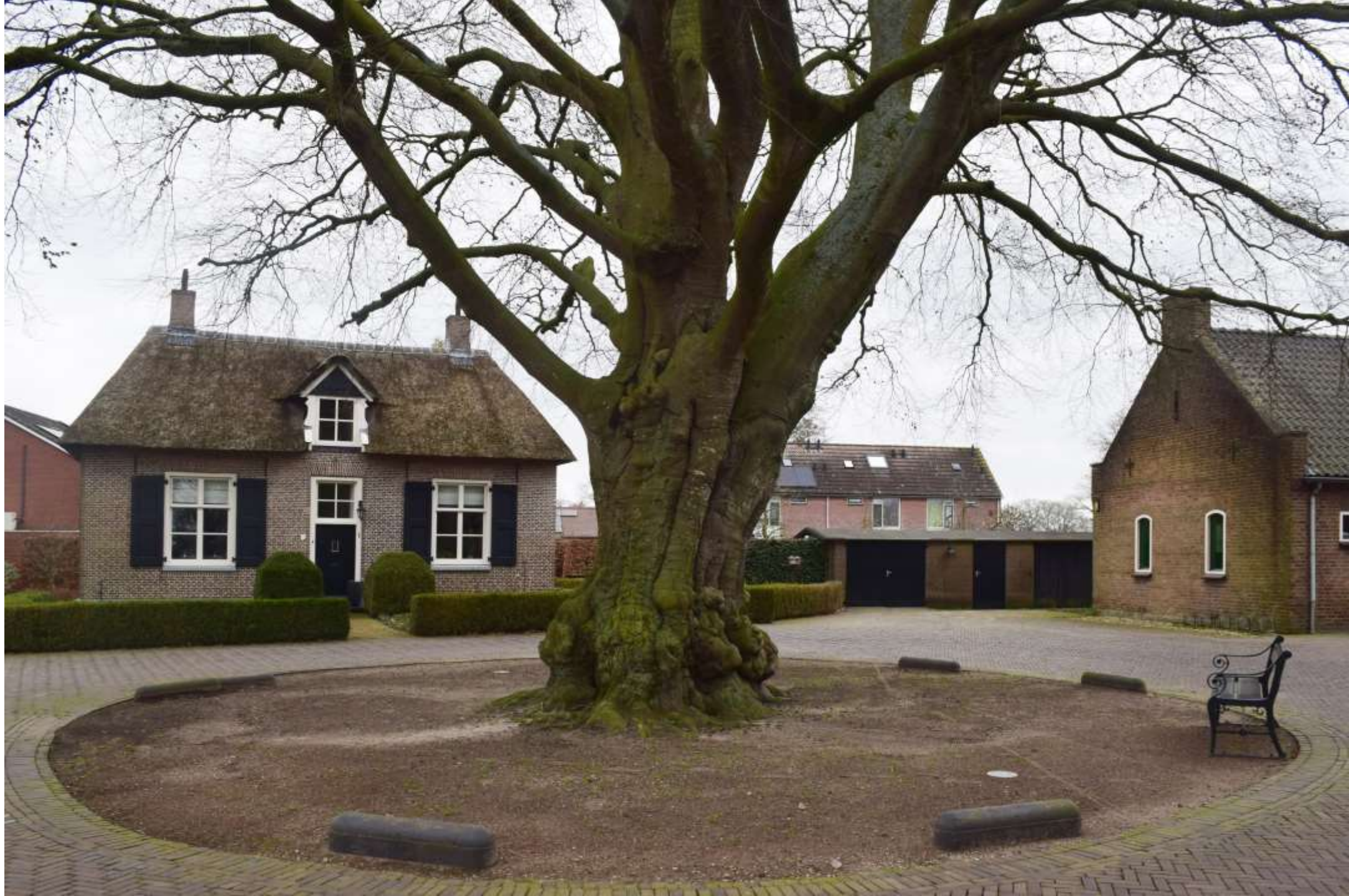
25-Wesepe, Dominee E. Kreikenlaan zonder rommeltjes