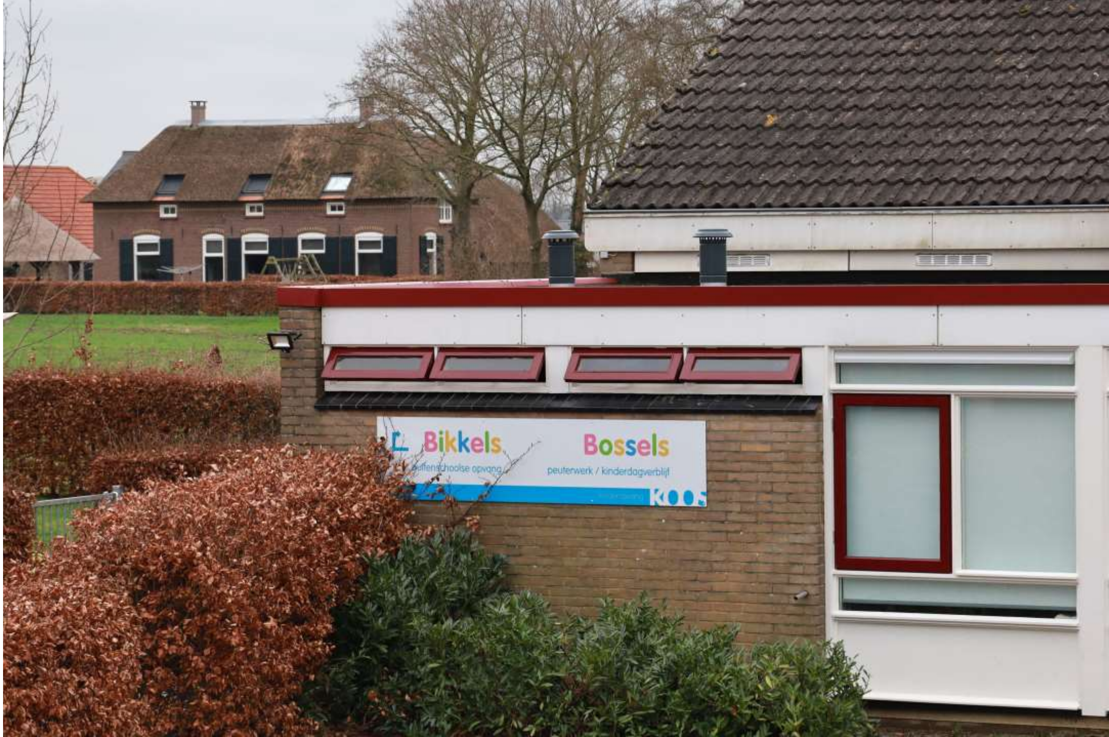
8-Wesepe kinderopvang bikkels met boerderij op achtergrond