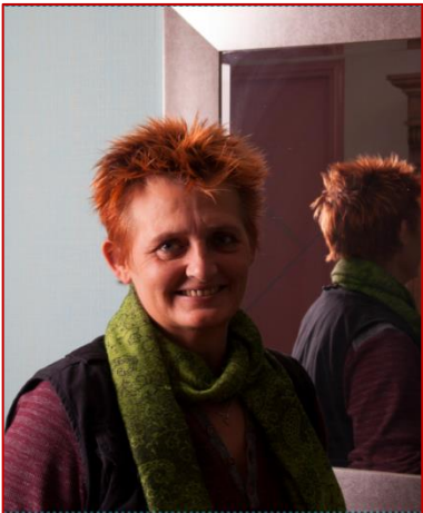
Resultaat van croppen