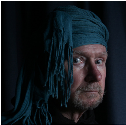
Origineel is te blauw en grijs