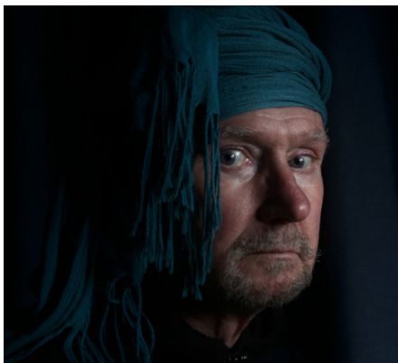
Kleurtemperatuur | meer rood toegevoegt