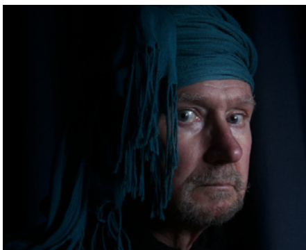
Schaduwen en hogelichten | meer zwart en grijs toegepast

https://daviesmediadesign.com/nl/project/geavanceerde-kleurcorrectie-in-gimp-2-10-met-het-hulpmiddel-niveaus/